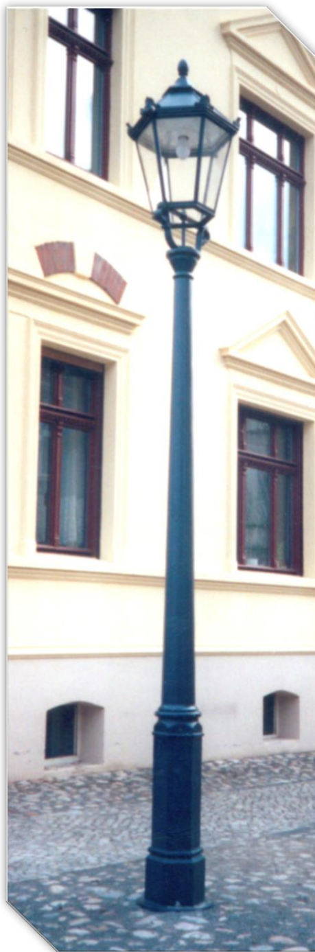
Tutaj na słupie żeliwnym THK-600/600A

Oprawa może występować w połączeniu z naszymi słupami żeliwnymi, wysięgnikami bądź też w kombinacjach wieloramiennych.