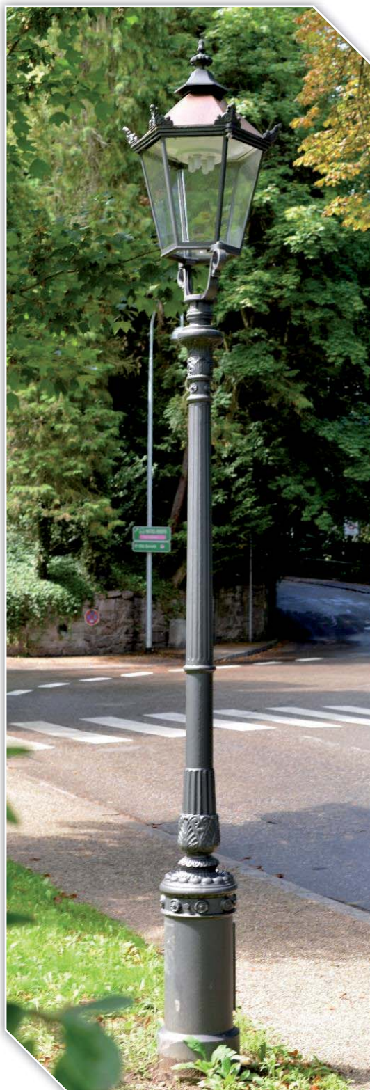
Tutaj na słupie żeliwnym THK-620/620A

Może występować w połączeniu ze słupami żeliwnymi, wysięgnikami bądź też w kombinacjach wieloramiennych.